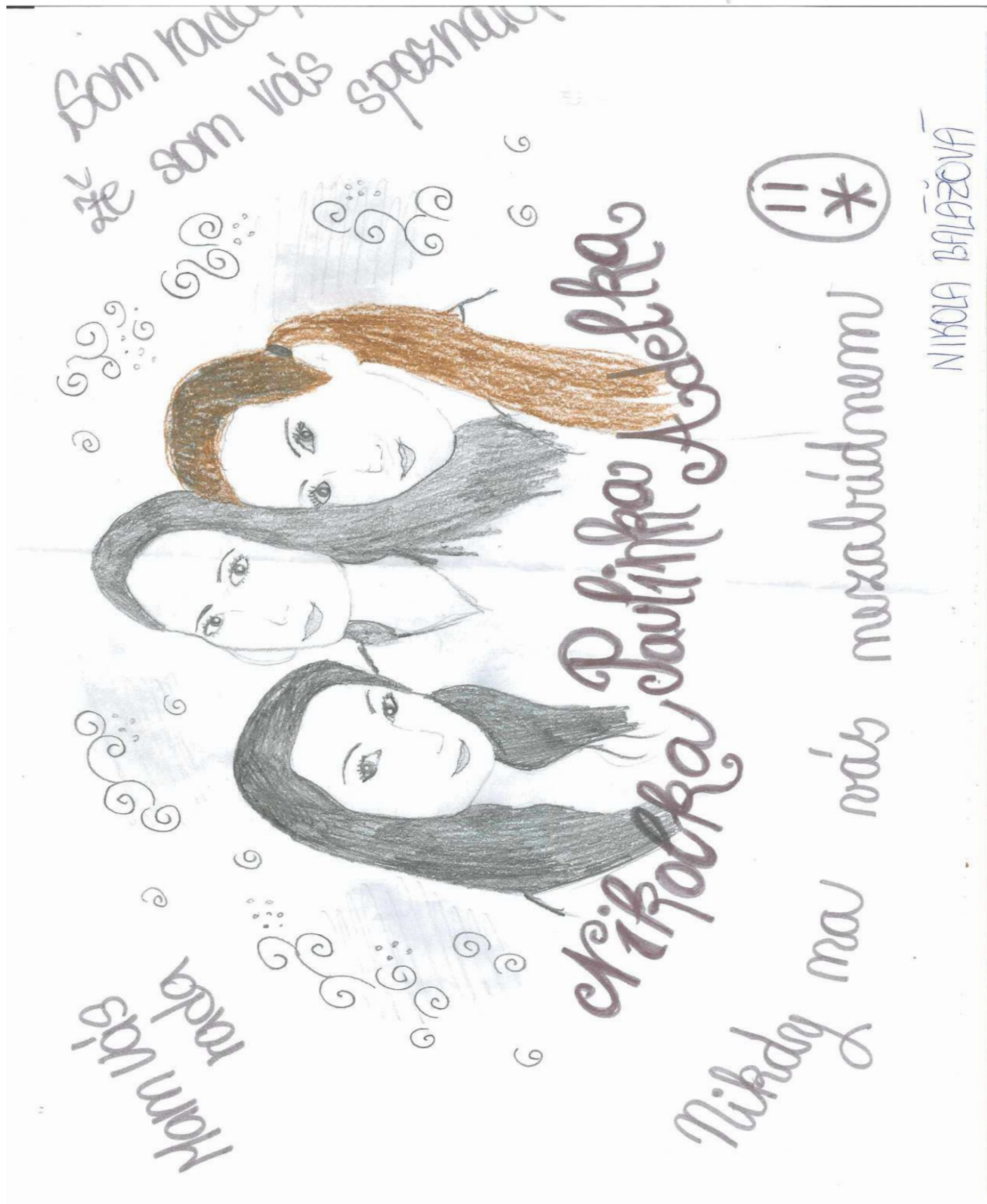
Kresba: NB - I.B