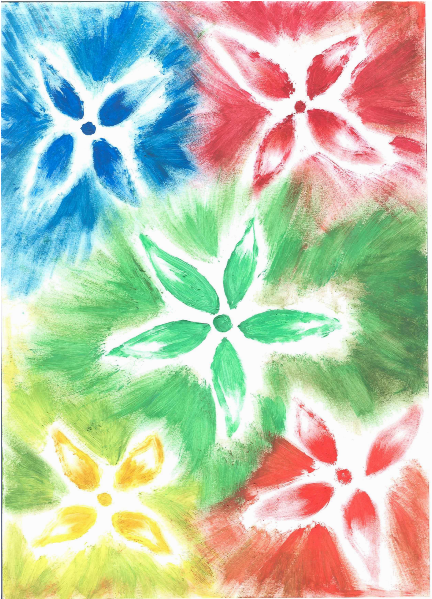
Kresba: OJ - III.A